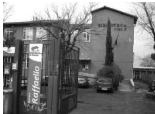
LA BIBLIOTECA RAFFAELLO