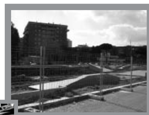
SKATEPARK IN COSTRUZIONE A CINECITTÀ EST

to di libero accesso ed utilizzo della struttura poiché solo in questo modo si può garantire una corretta aggregazione priva di discriminazioni sociali, favorendo oltre alla pratica dello skateboarding, il rispetto reciproco". Fra le proposte degli skaters per un corretto utilizzo dell'area ricordiamo la necessità di mantenere sempre aperto lo skatepark per assicurare a tutti la possibilità di utilizzare la struttura anche in seguito agli ordinari impegni quotidiani e l'allestimento di una buona illuminazione, magari regolata da un sensore crepuscolare, per garantire un'adeguata visibilità sfavorendo così infortuni causati dalla mancanza di quest'ultima. Come si legge nella petizione popolare a sostegno della destinazione pubblica e gratuita dello skatepark "il regolamento interno non ha bisogno di essere particolarmente prolisso, deve essere chiaro a tutti i fruitori dell'impianto che qualsiasi infortunio non può essere attribuito alla responsabilità del Municipio/Comune, è bene consigliare a tutti l'uso di protezioni imponendo l'obbligo di indossare il casco ai minori di 18 anni e di essere sotto la supervisione di un adulto ai minori di 11". Di conseguenza risulta chiaro che gli utenti de-