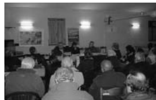
CONFERENZA URBANISTICA IN VIA GASPERINA

sario creare una mappatura di queste aree e strutture in ogni quartiere del X Municipio. E' emerso l'impegno a fare applicare la delibera comunale 110 che prevede una percentuale di affitti calmierati tra gli appartamenti costruiti da privati. Tra le proposte anche la richiesta dell'intervento sostanziale delle istituzioni che, per risolvere il problema della mancanza di alloggi, devono intervenire sul patrimonio in dismissione degli enti previdenziali acquisendo, dove necessario, le case ed evitando al massimo di costruirne altre per risolvere la mancanza di case popolari. L'assemblea ha rappresentato un punto di partenza importante per rilanciare un piano di difesa del territorio del X Municipio dove i cittadini, uniti, possano riprendersi la parola ed intervenire con forza per difendere la città: il bene comune più importante di Roma.