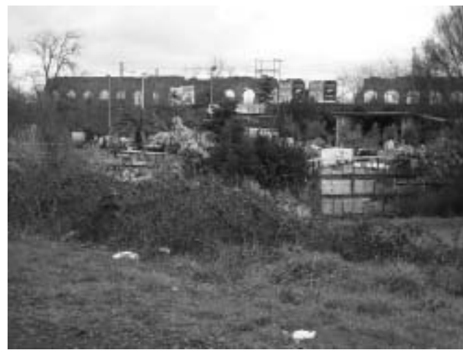
L'ABUSIVISMO AL PARCO DEGLI ACQUEDOTTI IN VIA DEL QUADRARO