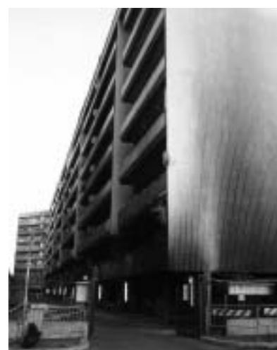
IL PALAZZO BRUCIATO IN VIA LIBERO LEONARDI

Dopo mesi dall'incendio i cittadini vengono ricevuti dal Sindaco