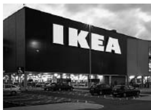
LA BIBLIOTECA RAFFAELLO

Da pochi giorni è apparso un grosso cartellone all'angolo tra via Tuscolana e via Biagio Petrocelli che annuncia l'apertura di un altro grosso centro commerciale nel nostro territorio. Tale apertura fa seguito a quella verificatasi a ottobre in via Alime-