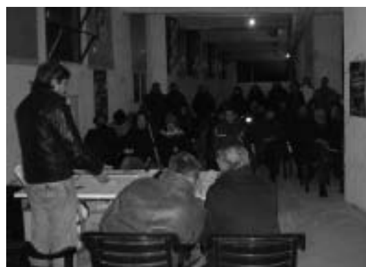
ASSEMBLEA PUBBLICA NEI LOCALI DELLA PALESTRA POPOLARE QUADRARO DI VIA TREVIRI

Il progetto, supportato da più di 700 firme