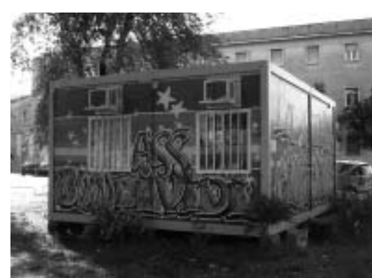
L'AMBULATORIO IN PIAZZA DEI DECENVIRI

latorio medico in cui chiunque può essere curato, italiani o stranieri che siano, senza il pericolo per questi ultimi di venire denunciati, laddove non abbiano permesso di soggiorno". "E' un piccolo ma concreto aiuto che aggiunge verso quegli immigrati bisognosi di cure, che rischiano di essere denunciati nel caso in cui si rivolgano alla sanità pubblica, oltretutto un modo consapevole e attivo per disobbedire all'infame provvedimento razzista votato in Senato dalla destra". Per l'evidente valore sociale di questo significativo servizio il Municipio si è impegnato a contribuire al progetto attraverso un piccolo sostegno economico, provvedendo alle spese delle utenze e offrendo la concessione del suolo pubblico.